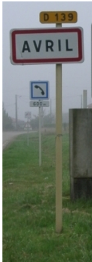
4 2021, Paris (poème de Jacques Jouet à Océane Mahé )

Avril est l'un de mes mois favoris lesquels, au fond, sont au nombre de douze tous éléments de l'année pot-pourri tant vivable qu'habitable pelouse sans que saison soit d'une autre jalouse. D'accord, on est trop vêtu, en avril mais reconnais qu'on ne va pas en ville en habit d'Ève ou costume d'Adam on dit que mai sera moins difficile alors, petite laine, en attendant.